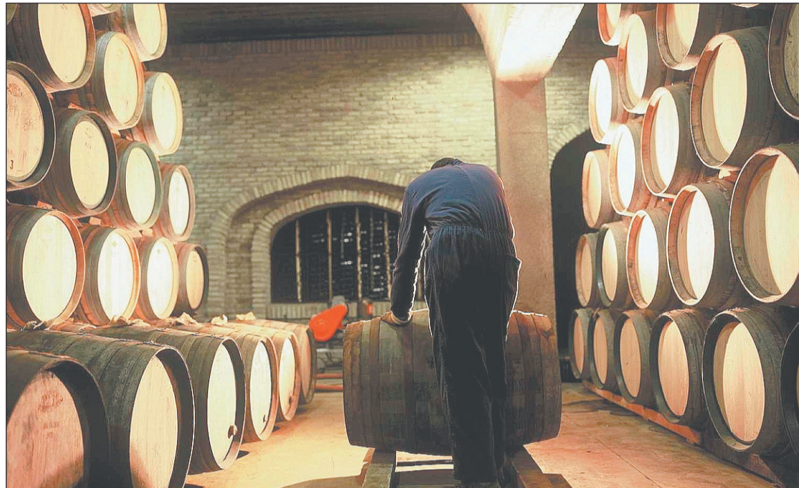
El método de limpieza con sulfuroso es sencillo, tradicional, efectivo y barato, según el sector.

El método conocido como 'mechado' es sencillo, tradicional, efectivo y barato: una má-